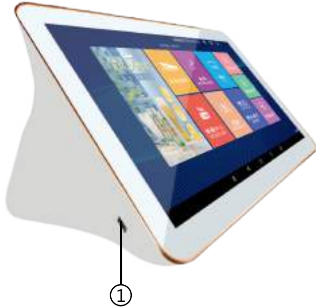
1. USB 2.0 輸入孔